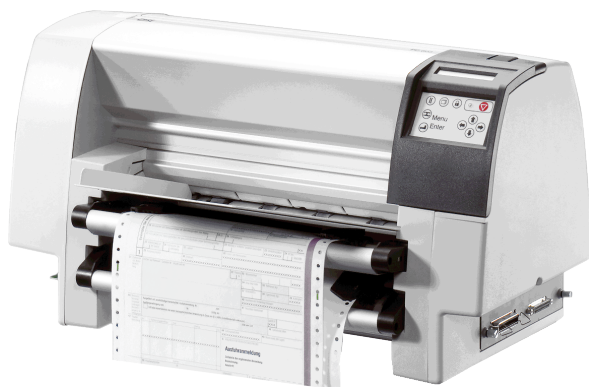
PP 803 / PP 803C mit integriertem Papierabschneider

Der Drucker PP 803 bietet eine professionelle Lösung für leistungsstarkes, flexibles und kosteneffizientes Drucken. Das robuste Metalldesign, die Papierlaufkontrolle und die Farbbandlaufkontrolle garantieren einen zuverlässigen unbeaufsichtigten Druck. Mit seinem bewährten Konnektivitätskonzept ist der Drucker für jede Netzwerkumgebung gerüstet.